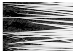
Fibres synthétiques ordinaires

La brosse Aqua Blue est composée d'un assemblage innovant de fibres synthétiques qui offre à la fois une excellente finition de peinture, améliore le confort de travail et augmente la productivité sur les chantiers. D'une part, la haute densité des fibres permet une excellente charge et une dépose régulière de la peinture pour un résultat très opaque. D'autre part, l'extrême finesse des fibres de l' Aqua Blue supprime les effets de cordage, c'est-à-dire lorsque les stries des fibres laissent des traces sur la surface peinte.